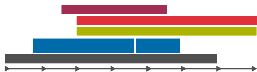
Abb. 2: Beispiel für eine Ausbildungsdauer von 7 Semestern

Sie sind flexibel in der Gestaltung Ihrer Ausbildung – Ihr Ablauf kann z.B. so sein: